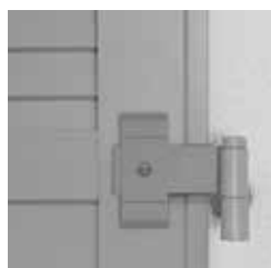
Expressband mit Sicherungsring