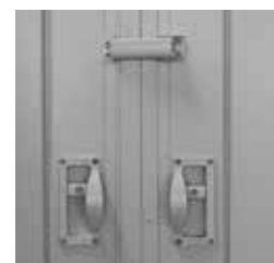
Schieber und Zentralverschluss