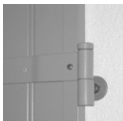
Gonds de sécurité