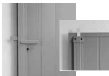
Crémone (en applique)