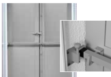
Barre de sécurité

D'autres mesures permettant d'encore accroître la sécurité sont les barres de sécurité et crémones montées sur la face intérieure du volet battant. Les verrous et serrures supplémentaires, très efficaces, peuvent être actionnés en toute simplicité après la fermeture des volets.